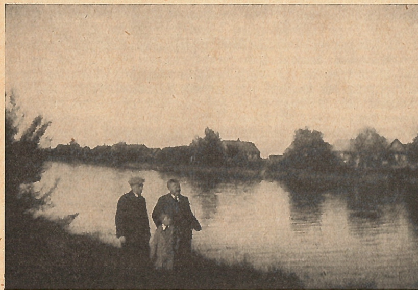
Dorf Aſſi-Šchorno an der Pſuſſa, 15 km von Narwa, 2 km von der Sowjetgrenze.